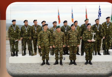
1 η Πανελλήνιοι Σκοπευτικοί Αγώνες Εθνοφυλακής