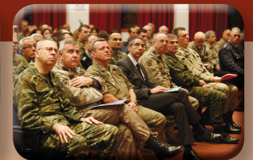
Τελετή Λήξης «Έτους Εφεδρείας και Εθνοφυλακής» του ΓΕΕΦ